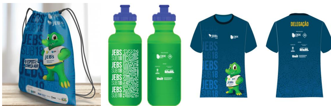
Composição do Kit JEB's Sub 18 2024 – Sacochila, Squeeze e Camiseta