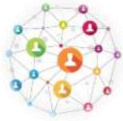
Organización del deporte escolar Peruano