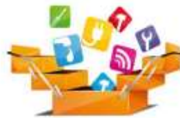
Herramientas por la busqueda de talentos