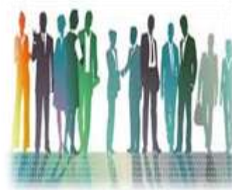
Recursos humanos y monitoreo