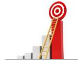
Desafíos para mejorar las performances del deporte escolar